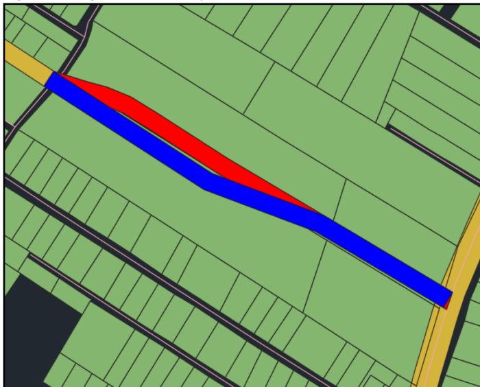
Figura 1 - Alteração de traçado da via projetada Sub Coletora Insular 832 (SCI-832)