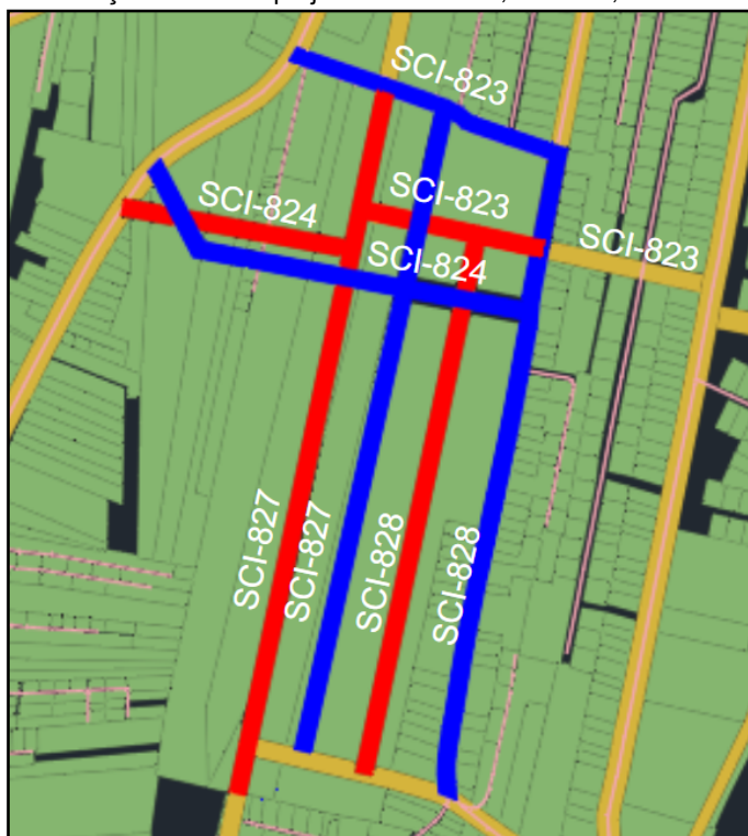
Figura 1 - Alterações das vias projetadas SCI-823, SCI-824, SCI-827 e SCI-828