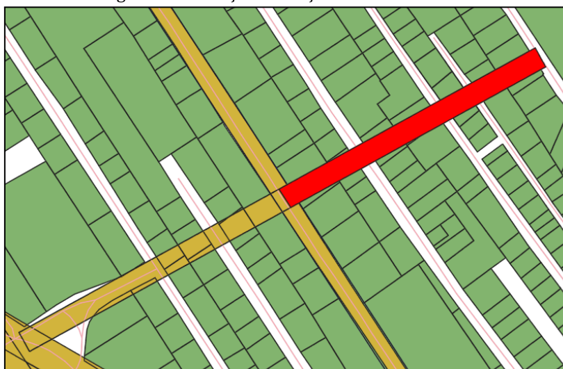
Figura 1 - Alteração no traçado da via SCI-703