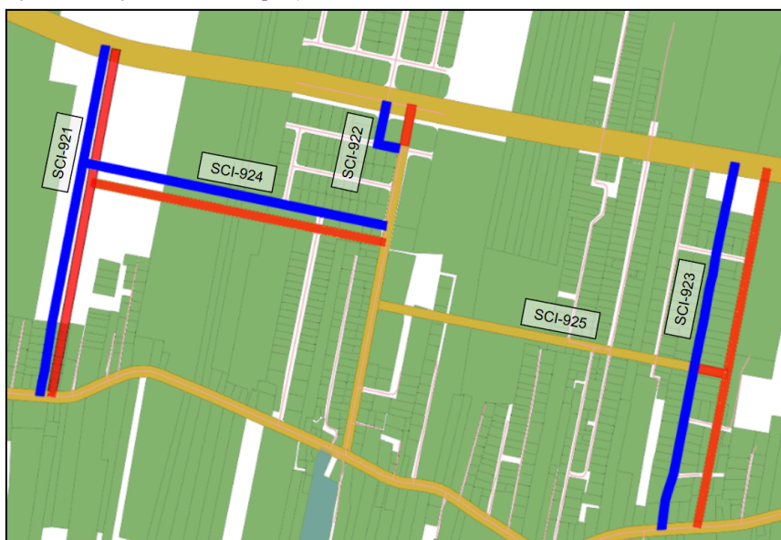
Figura 1 - Atualização de traçado das vias projetadas SCI-921, SCI-922, SCI-923, SCI-924 e SCI-925.