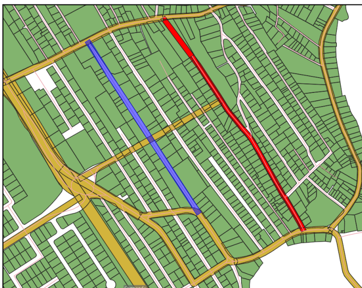
Figura 3 - Alteração do traçado da via projetada SCI-702.