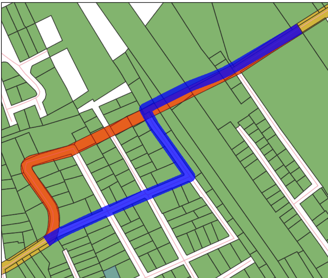
Figura 2 - Alteração de traçado da via projetada SCC-32.