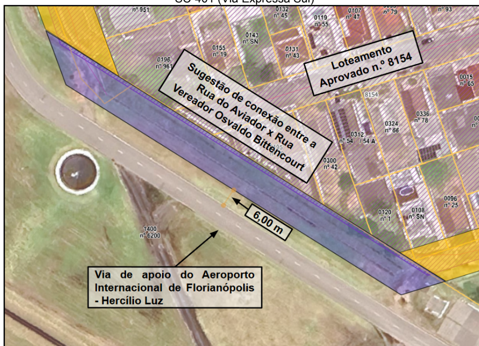
Figura 1 - Mapa do Sistema Viário Municipal - Previsão de conexões da Rua Arco-íris e Rua do Aviador com a SC-401 (Via Expressa Sul)