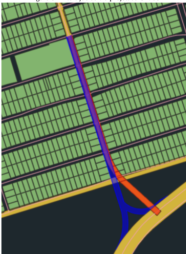
Figura 3 - Alteração da via projetada CI-908