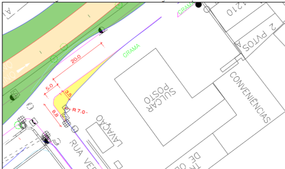
Figura 1 - Exclusão do projeto de interseção (PI-701)